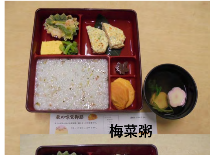
秋の味覚御膳 梅菜粥