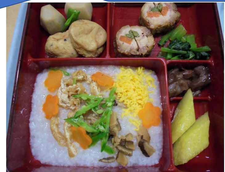
ちらし粥（一口カット）